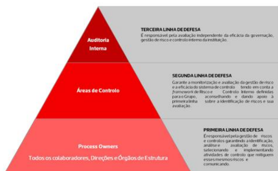
Figura 1 – Abordagem das três linhas de Defesa

3ª Linha de defesa: Função de Auditoria Interna, que realiza análises independentes e orientadas para o risco.